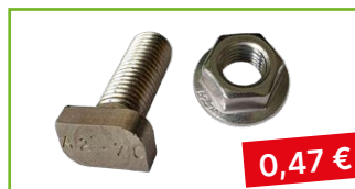
T-šroub + matice M10×25