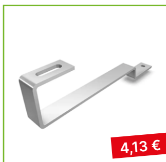
Střešní hák typ „B“