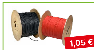
Solar kabel „6“ návin 500 m černá | červená