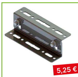
Střešní držák Satjam 90×40 mm