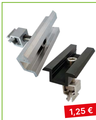
Středový úchyt výška 30 | 35 mm stříbrná | černá