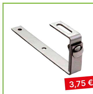
Střešní hák typ „J“