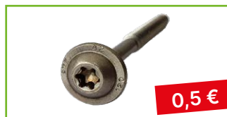
Vrut 8×80/50 nerez - balení 100 ks