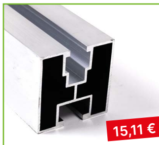
AL profil 40×40 délka 3,3 m

pro elektroinstalatérské firmy, platí od 1. 2. 2025 do vyprodání zásob nebo vydání nového ceníku