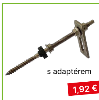
Kombinovaný šroub M10×200