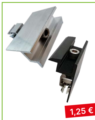
Krajní úchyt výška 30 | 35 mm stříbrná | černá