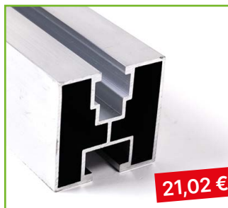
AL profil 40×40 délka 4,4 m