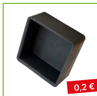
Koncovká krytka AL profilu