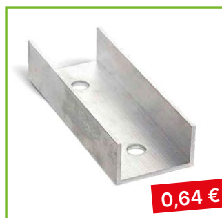
Spojka AL profilu délka 200 mm