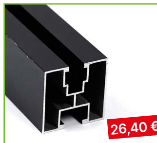
AL profil 40×40 černý délka 4,4 m