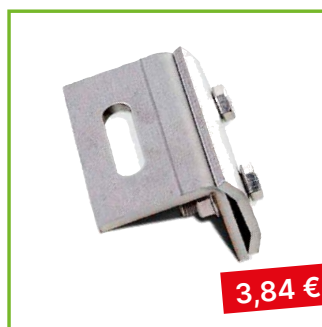
Střešní držák falcový pro falcy do 3,5 mm