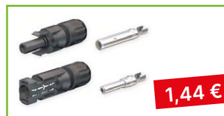
Konektor MC4 sada M+F