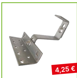
Střešní hák 3× stavitelný