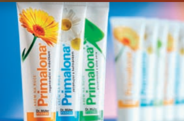
Ochranné krémy na ruce 33