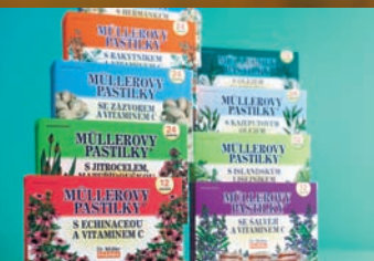
Müllerovy pastilky® 21-24