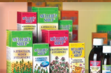
Müllerovy sirupy® 26-28