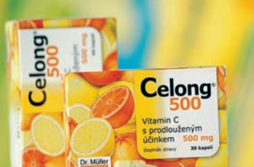
Celong® 500 8