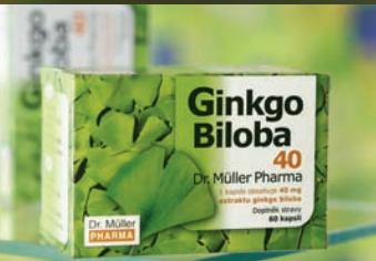
Ginkgo Biloba 12