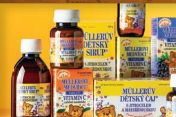
Müllerovi medvidci® Přípravky pro děti 29-31