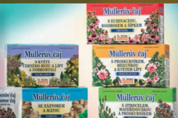
Müllerovy čaje® 24-25