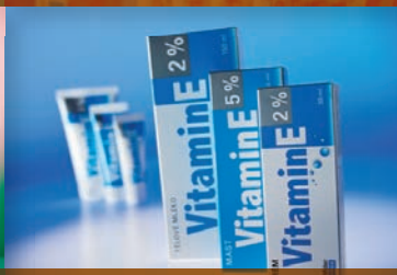
Vitamin E 53