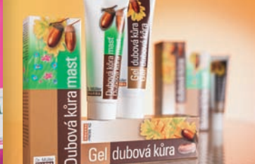
Dubová kúra 11