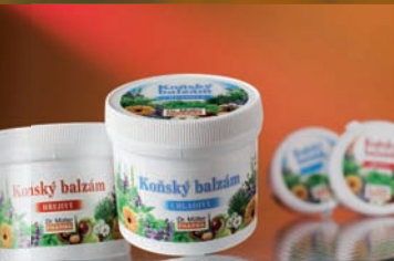
Košské balzámy 15