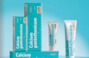
Calcium pantothenicum 6