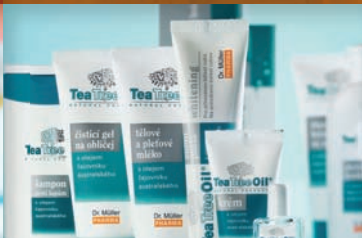
Oil čajovníku australského 34-38