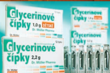
Glycerinové čípky 13