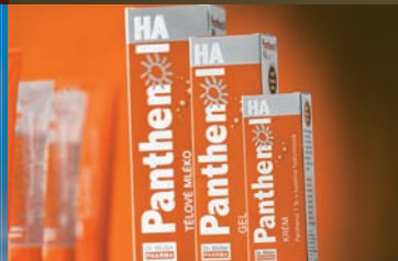
Panthenol HA 44