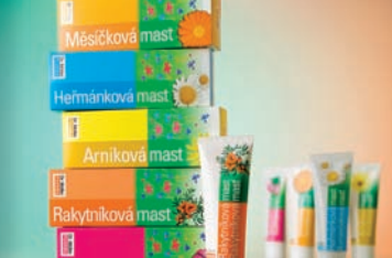
Bylinné masti 6-8