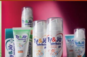
Lubrikační gely Ty&Já® 18-20