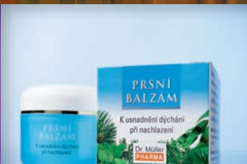
Prsní balzám 46