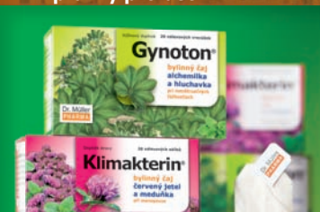
Přípravky pro ženy 47