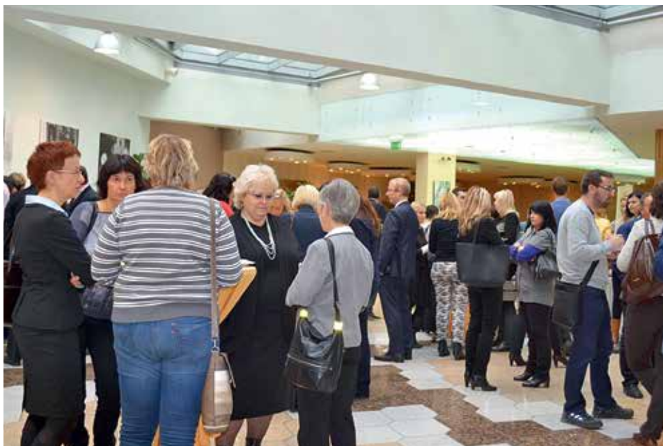
DISKuze MIMO SÁL. I v průběhu přestávky se živě diskutovalo...