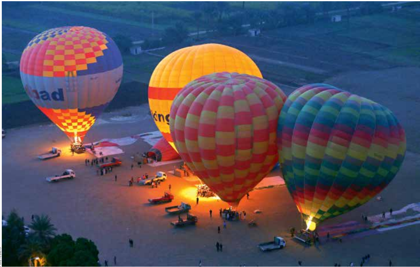
RÁNO NAD LUXOREM. Poslední přípravy na vzlet horkovzdušných balonů s turisty před východem slunce nad egyptským Luxorem.